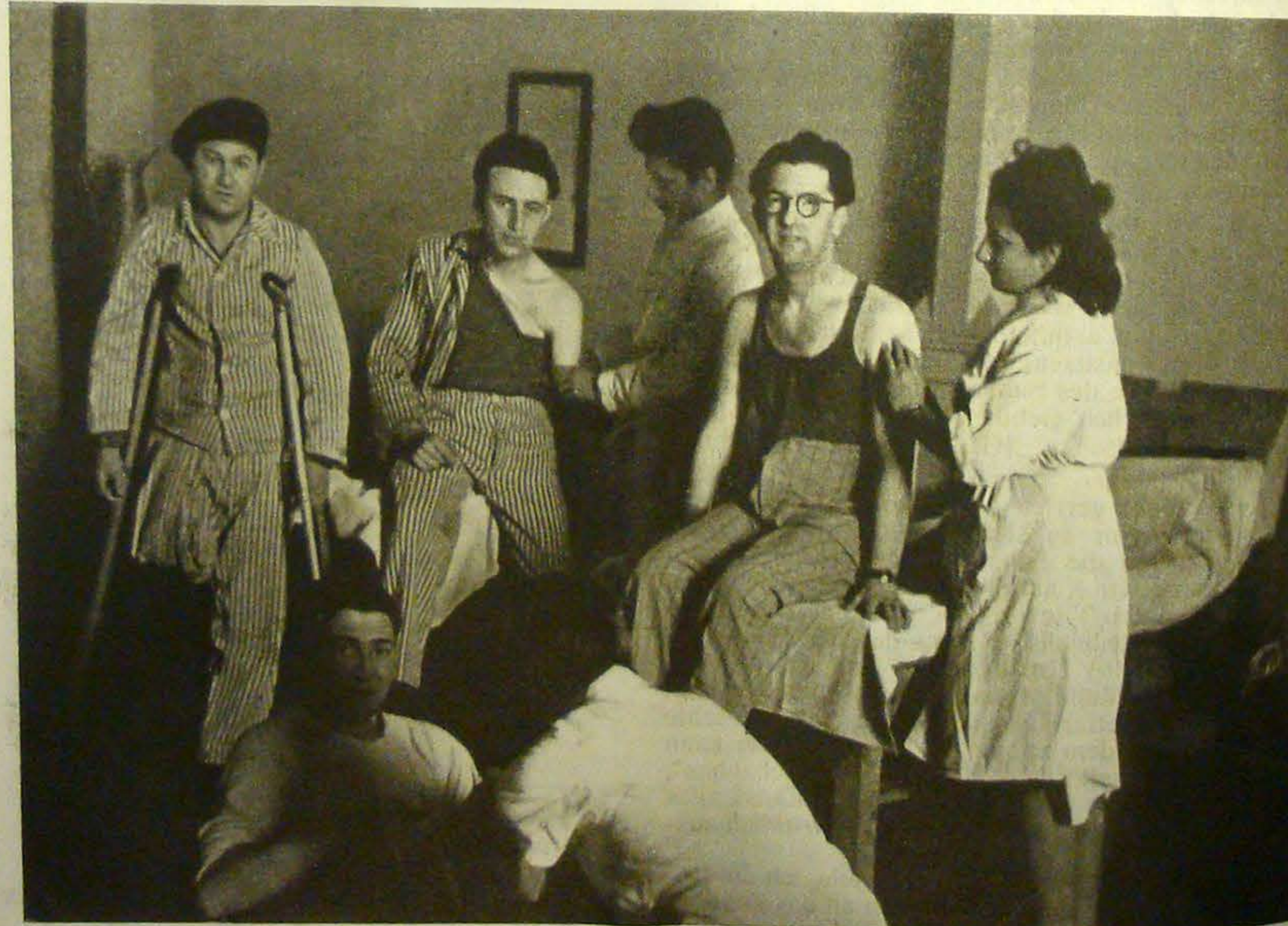
Sechs Jahre Ghetto- und K.Z.-Leben und Partisanenkämpfe haben auch den mit dem Leben Davongekommenen schwere Narben hinterlassen. In St. Ottilien versuchen jüdische Aerzte, diese Wunden zu heilen.