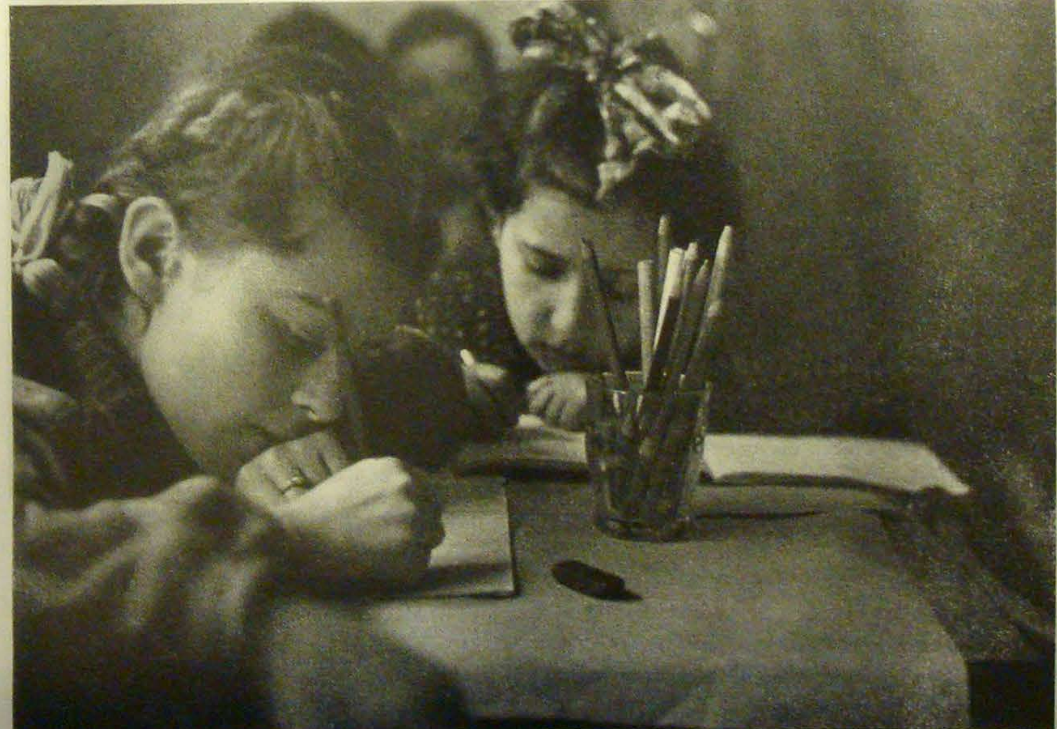
und einen Kindergarten für unsere Waisenkinder.